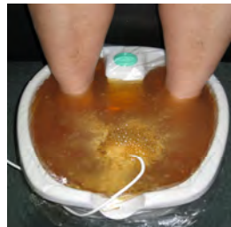
20 minuutin kuluttua