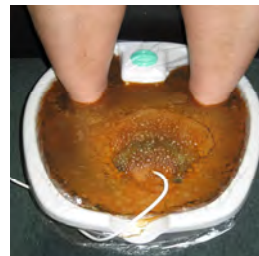
30 minuutin kuluttua

Pimeäkenttämikroskooppitutkimukset ovat osoittaneet, että Ion Detox –jalkakylpy parantaa happitoisuustasoa.