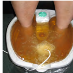
10 minuutin kuluttua